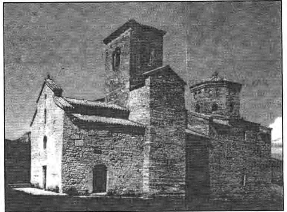
Бурђеве стубови код Берана