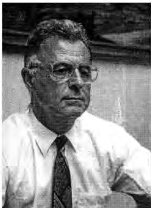
ПРОФ. ДР МИОДРАГ ЗЕЧЕВИЋ

МИОДРАГ ЗЕЧЕВИЋ је рођен 1. 5. 1939. године у Виницкој код Берана. Гимназију је завршио у Беранама.