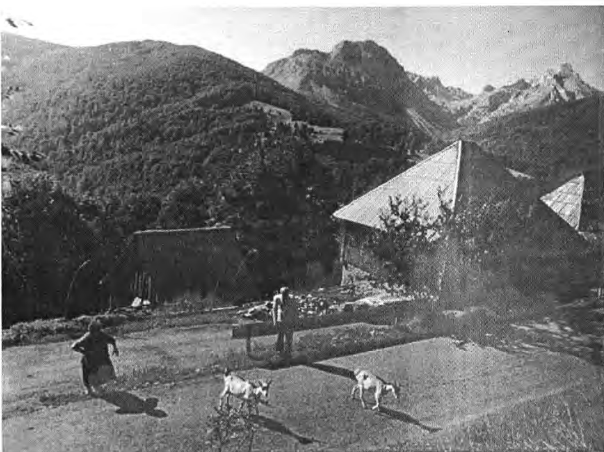
Васојевићи - Трешњевик (поткомље)