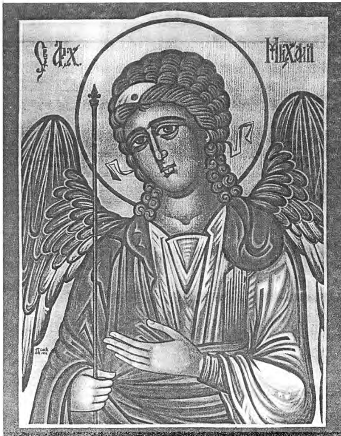
СВЕТИ АРХАНГЕЛ МИХАИЛ

Сваки је дан у црквеном календару празник неба и земље. Али оно што је укорено у души српског народа, а што га уједно и разликује од осталих православних народа је празновање крсне славе. Специфичност славе, по речима нашег Патријарха, његове Светости господина Павла, састоји се у томе што «овај наш лепо обичај није свечаност појединца, као што је на пример имендан или рођендан, обичаји који постоје и код хришћанских православних народа, него представља славље шире заједнице – једне или више породица, чак племена. С правом се говори и пише да су Срби препознатљиви управо по обичају слављења славе, ма где живе или ма када да су живели откако су крштен народ. Слава се као домаћи богослужбени чин коначно и трајно утврдила од времена Светог Саве. У време Светог Александра патријарха Александријског, неколико година пред Први Васељенски Сабор, Никејски би установљено да се празник Светог Архангела Михаила и осталих Бестелесних Сила Небеских празнује 8-ог новембра по старом, односно 21-ог новембра по новом календару, те тако и Васојевићи као потомци Немањића, на овај дан славе своју крсну славу, и по томе се у читавом свету познаје Немањића сој .