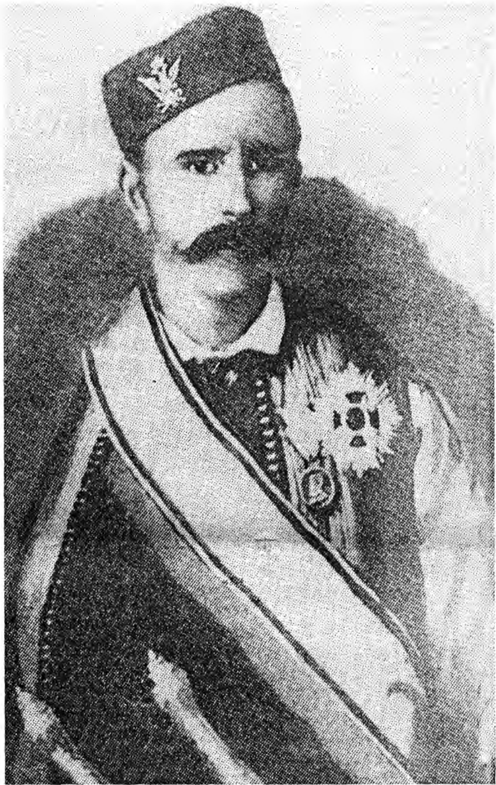
Војвода Миљан Вуков, васојевићки војвода и црногорски сенатор

Четрдесетих година прошлога вијека у Васојевићима отпочео је велики покрет народног ослобођења од Турака са циљем припајања слободном дијелу Црне Горе и Црногорској држави. Војни и политички стратег овога подухвата је прослављени војвода Миљан Вуков - Вешовић. Уз помоћ врских народних главара и првака Миљан Вуков је успио да за непуну деценију свога опасног прегнућа изврши духовно и политичко сједињавање свих братстава на територији Лијеве Ријеке и Лимске долине и да их тако хомогене и обједињене прикључи слободном дијелу Црне Горе. Овим актом увећана је територија Црне Горе готово исто онолико колико је износила под влашћу владика из куће Петровића. Утицајно је порастао број становништва које се отргло испод непосредне или посредне Отоманске управе.